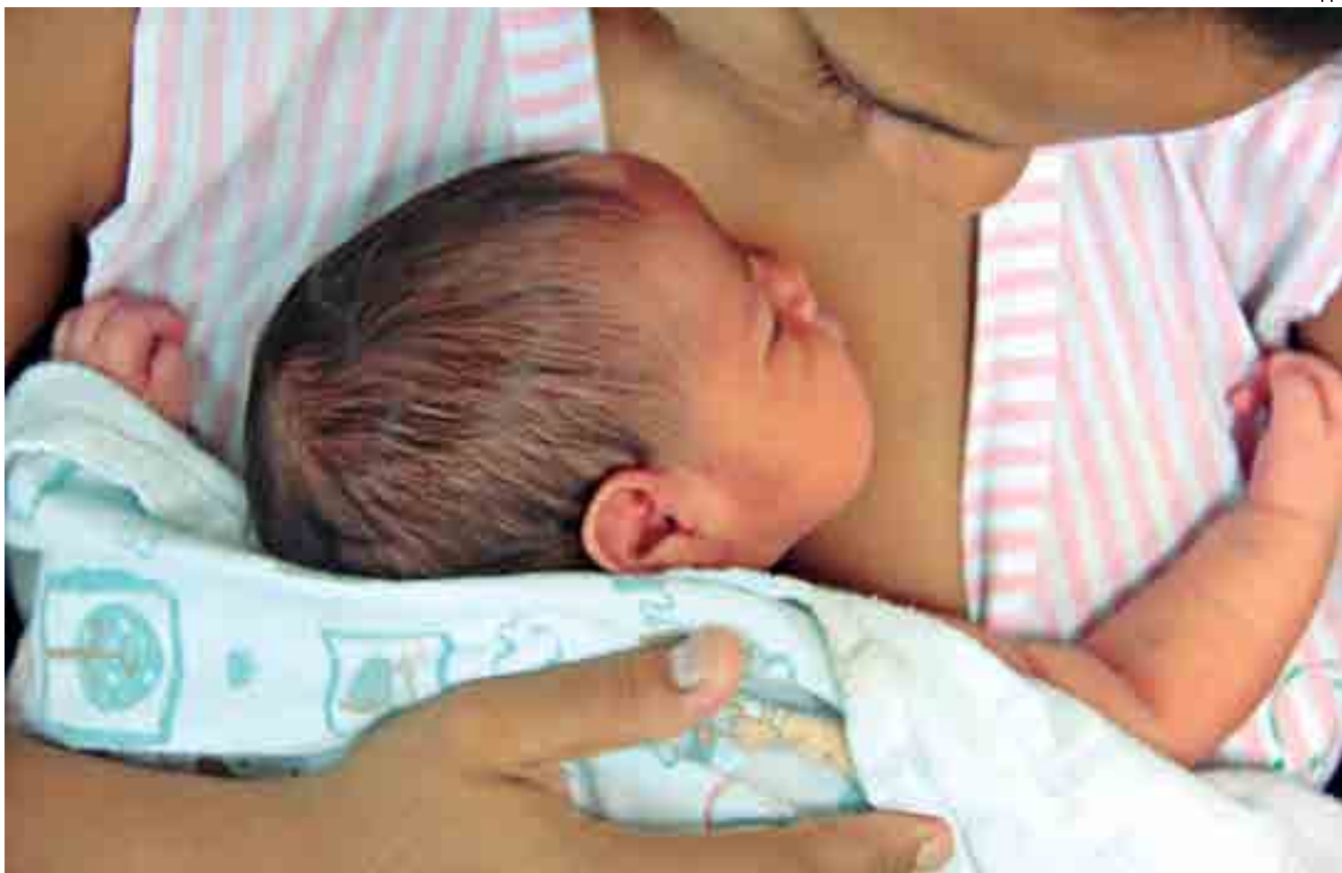
Equipe clínica vê importância do uso de leite humano para todos os bebês que nascem nos hospitais e que por algum momento a mãe não pode prover a alimentação

A diretora ainda acrescenta: “Ver cada vez mais a equipe