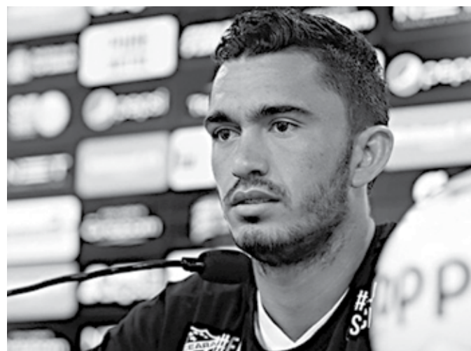
Volante de 21 anos tem contrato com o Ceará até o dia 30 de maio