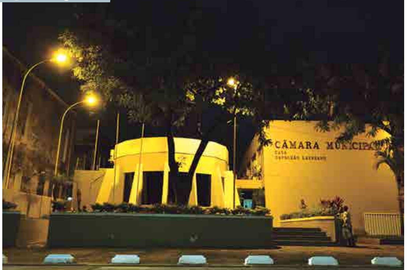
Além da audiência pública com prestação de contas de secretário prevista para essa semana, Câmara discute Maio Amarelo e presta homenagens