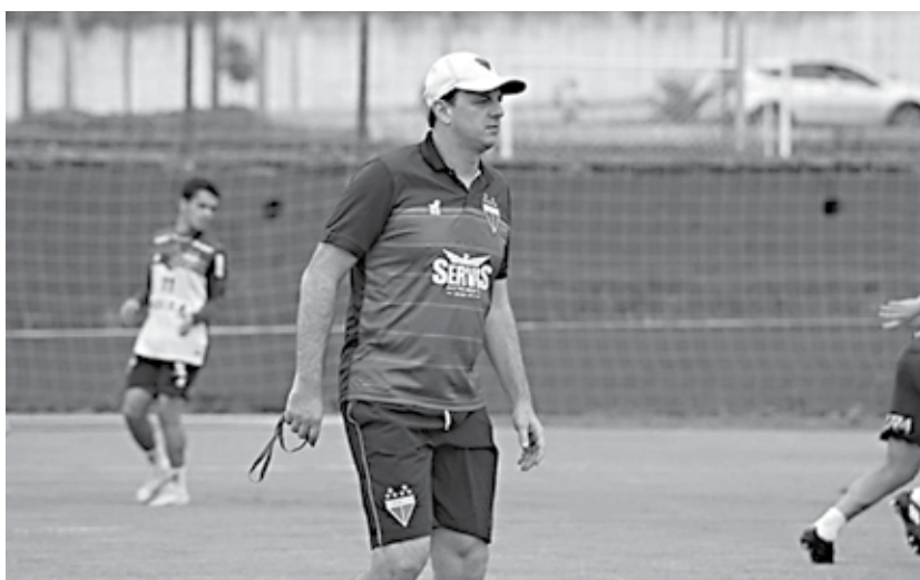
Comandante do Vovô elogia desempenho do grupo na Série B do Brasileiro