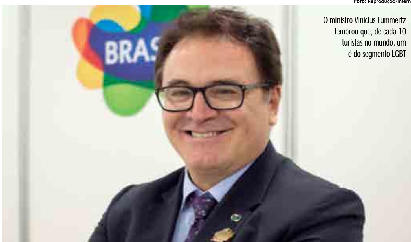
O ministro Vinicius Lummertz lembrou que, de cada 10 turistas no mundo, um é do segmento LGBT

"O Brasil é uma nação muito conservadora, ainda que diversa, mas o turismo faz muitas coisas acontece-